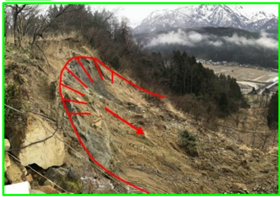
新潟県糸魚川市大字中野口 いといがわ なかのくち