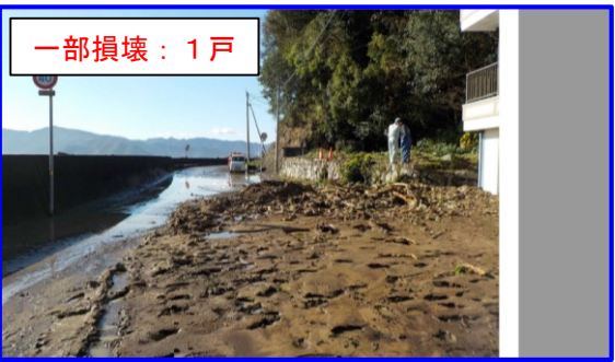
大分県佐伯市大入島 さえき おおにゆうじま