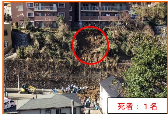
神奈川県逗子市池子 ずし いけこ