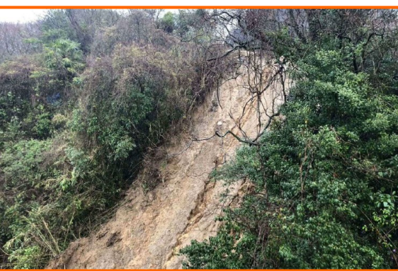
広島県広島市西区山田町 ひろしま にし やまだちよう