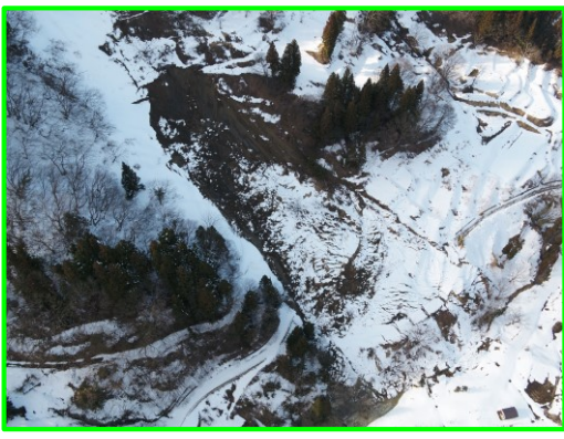
新潟県妙高市大字下平丸 みょうこう しもひらまる