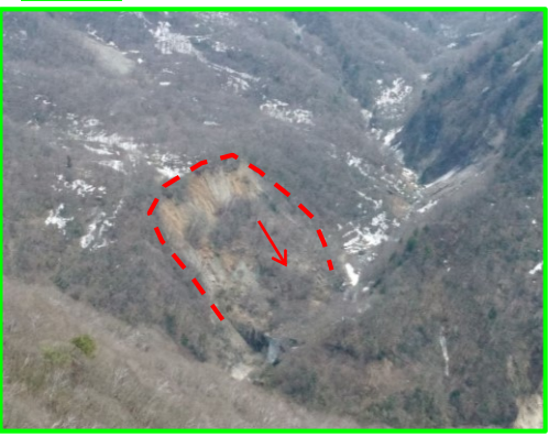
長野県下高井郡山ノ内町大字平穂 しもたかい やまのうち ひらお