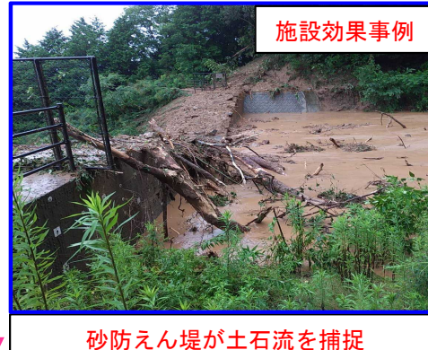
ひろしま にし いのちだい 広島県広島市西区井口台3丁目