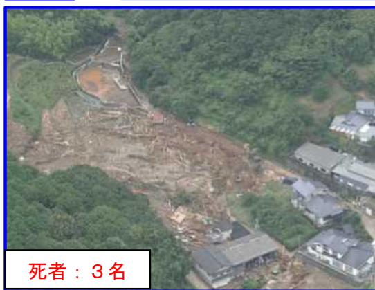
あしきた つなぎまち ふくはま 熊本県葦北郡津奈木町福浜