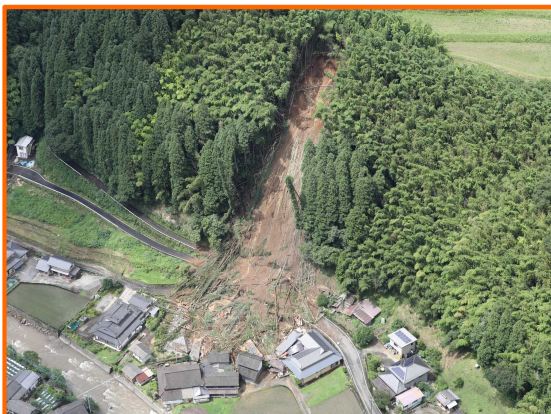
ひた あまがせまち あかいわ 大分県日田市天瀬町赤岩