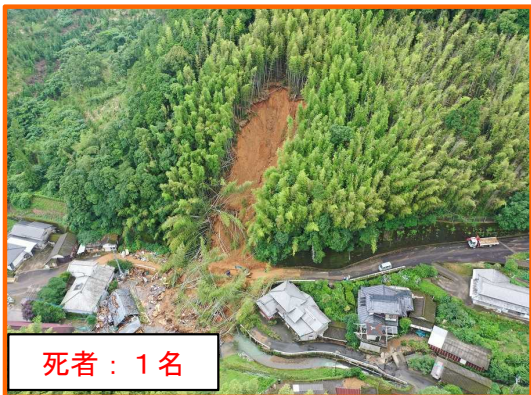
あしきた あしきたまち ふしき 熊本県葦北郡芦北町伏木氏