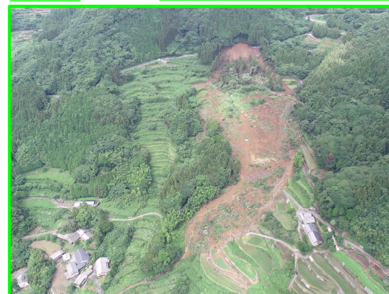
させぼ おがわちよう 長崎県佐世保市小川内町