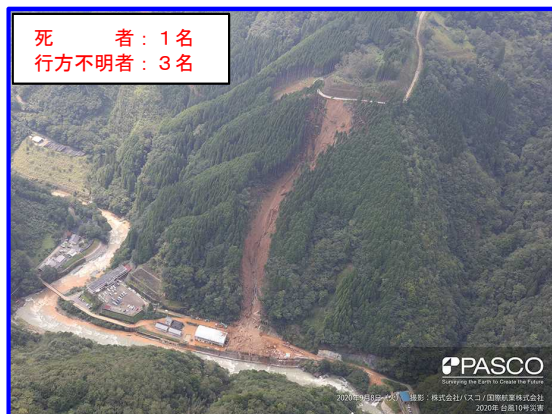
ひがしうすき ししばそん しもふくら 宮崎県東臼杵郡椎葉村下福良