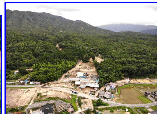
7/8 土石流等 たかしま はいど 滋賀県高島市拝戸