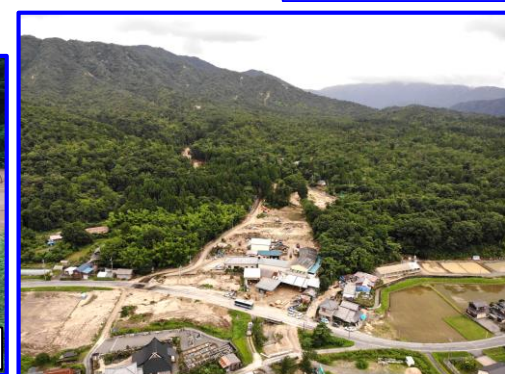
7/8 土石流等 たかしま はいど 滋賀県高島市拝戸