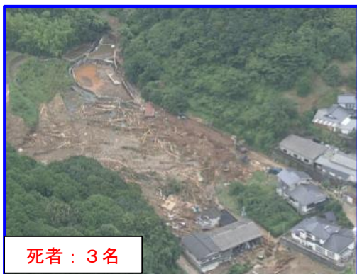
あしきた つなぎまち ふくはま 熊本県葦北郡津奈木町福浜