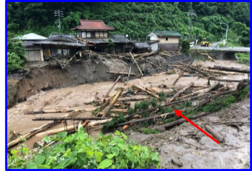
たかやま いわいまち ねむき 岐阜県高山市岩井町眠木