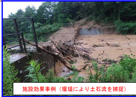
ひろしま にしく いのくちだい 広島県広島市西区井口台3丁目