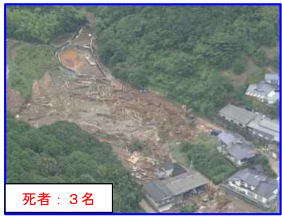
7/4 あしきた つなぎまち ふくはま 熊本県葦北郡津奈木町福浜

人的被害 : 死者 17名 家屋被害 : 全壊 31戸 半壊 16戸 一部損壊 132戸