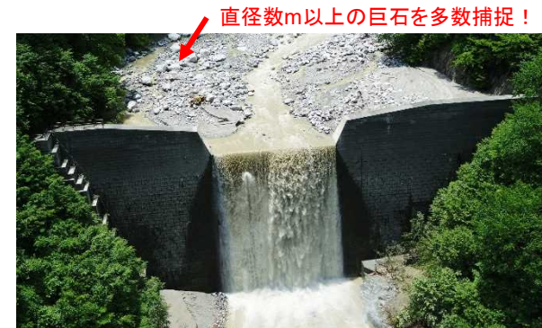
飯島第6砂防堰堤の捕捉状況