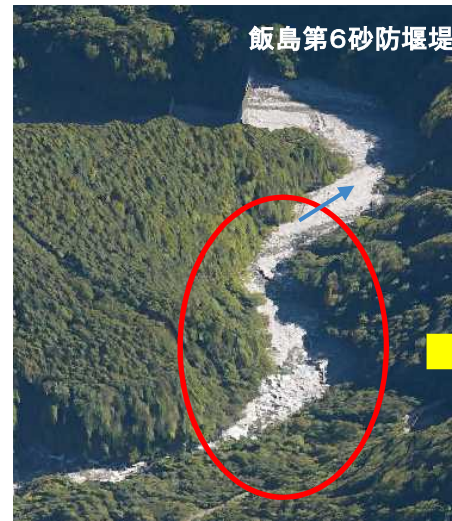
捕捉前(令和元年11月 オルソ画像)