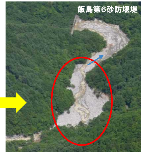
捕捉後(令和2年6月15日)