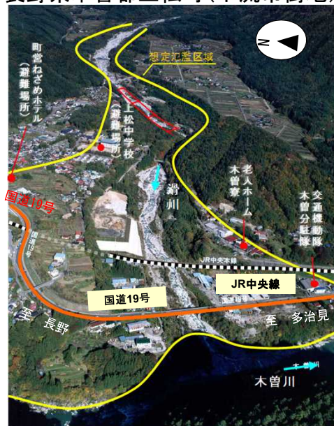
重要交通網、市街地を保全