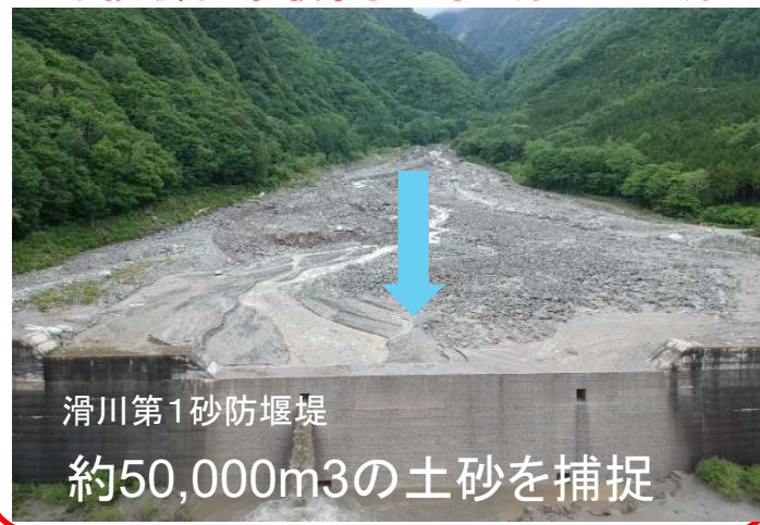
滑川第1砂防堰堤 約50,000m3の土砂を捕捉