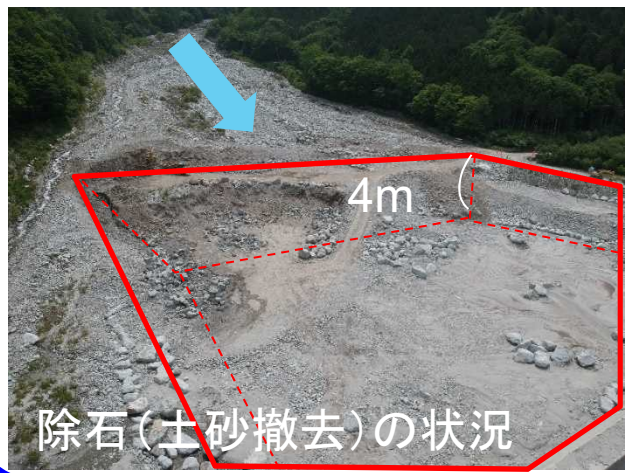
除石(土砂撤去)の状況