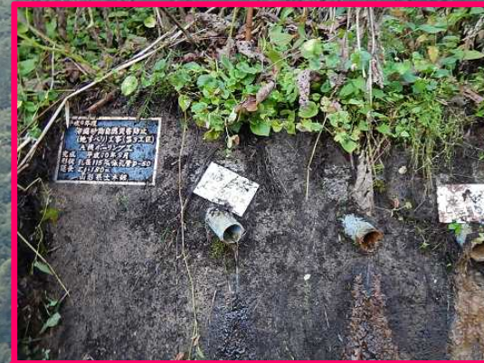
同地区内の既設横ボーリング工