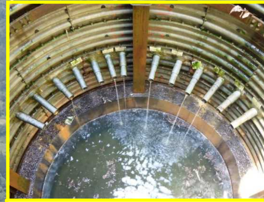
同地区内の既設集水井工