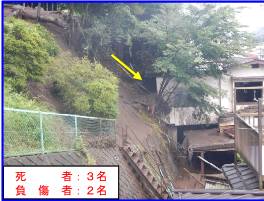
8/15 おかやしかわぎしひがし 長野県岡谷市川岸東