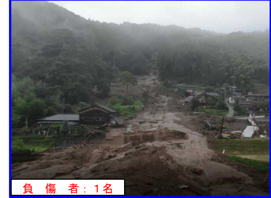
8/14 かんざきしかんざきちょう 佐賀県神埼市神埼町