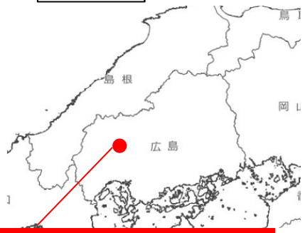
広島県山県郡北広島町本地