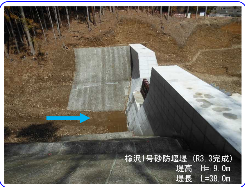
土石流発生前 (R3.3.29撮影)