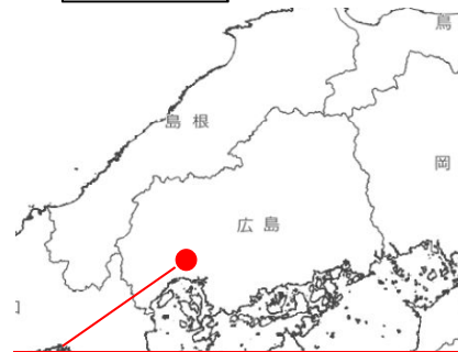
広島県広島市安佐南区山本町