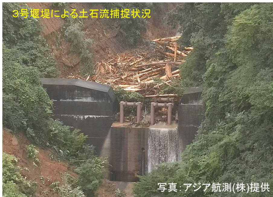
3号堰堤による土石流捕捉状況