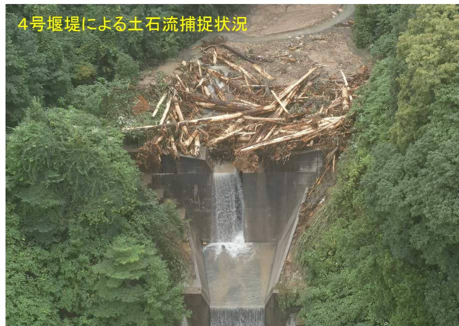
4号堰堤による土石流捕捉状況