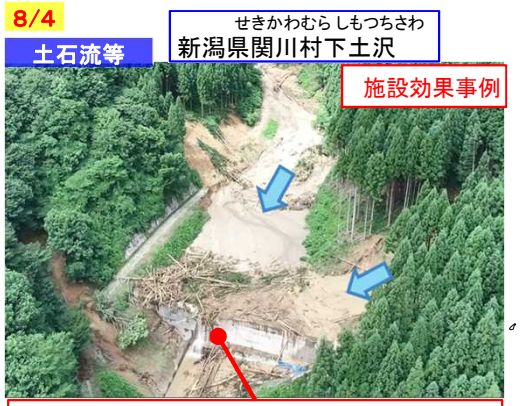
砂防えん堤が土石流を捕捉