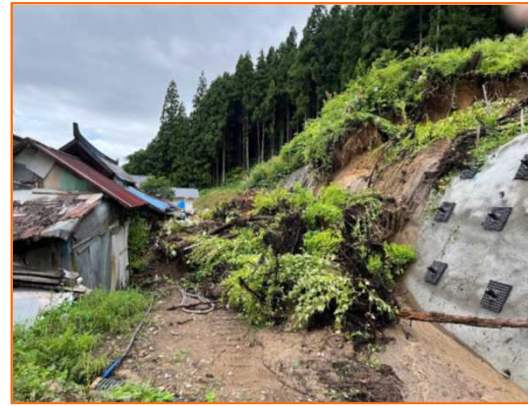
8/4 きたかたし あつしおかのうまち 福島県喜多方市熱塩加納町