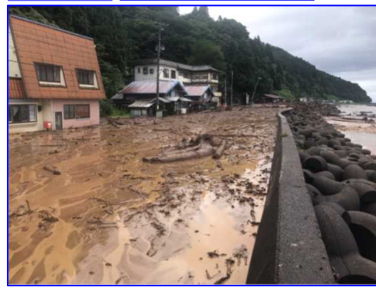
8/13 そとがはままち たいらだて 青森県外ヶ浜町平館