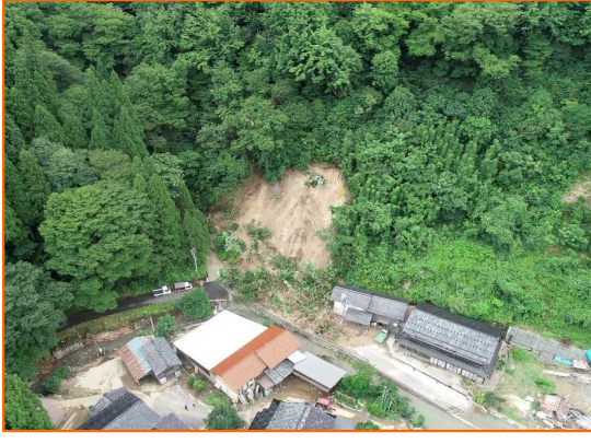
8/5 こまつし なかのとうげまち 石川県小松市中ノ峠町