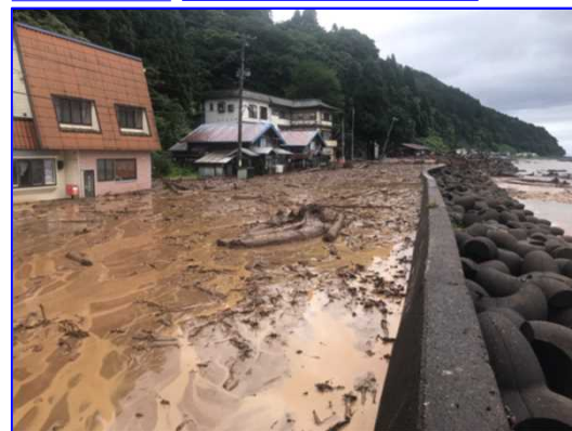
8/13 土石流等 そとがはままち たいらだて 青森県外ヶ浜町平館