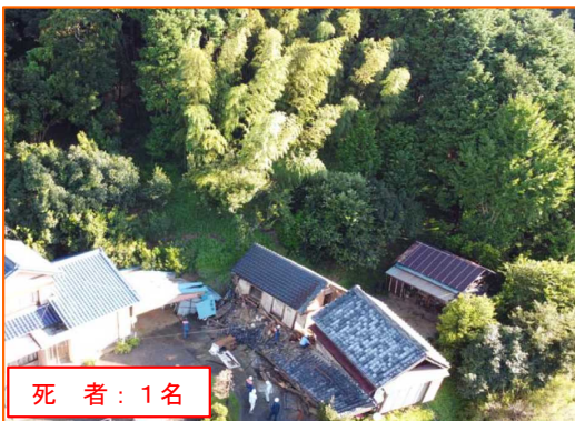
9/24 かけがわしゆけ 静岡県掛川市遊家