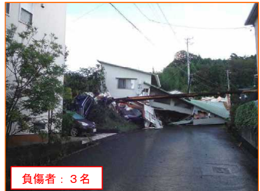
9/24 はまつしてんりゆうくりよくけいだい 静岡県浜松市天竜区緑恵台