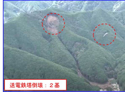
9/24 しずおかしあおいくあしくぼくちぐみ 静岡県静岡市葵区足久保口組