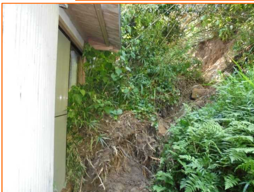
9/23 おかざきしこうりゆうじちようほんごう 愛知県岡崎市高隆寺町本郷