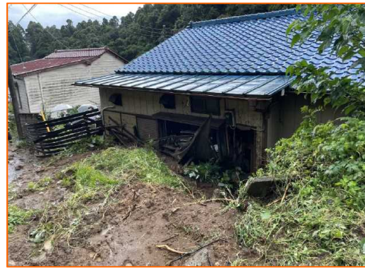
9/24 土石流等 かけ崩れ かつとりし さわらい 千葉県香取市佐原イ