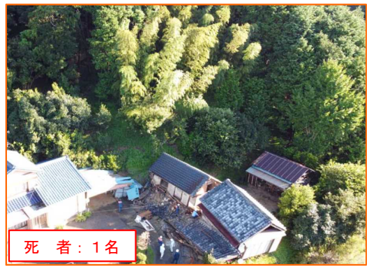
9/24 かけがわしゆけ 静岡県掛川市遊家