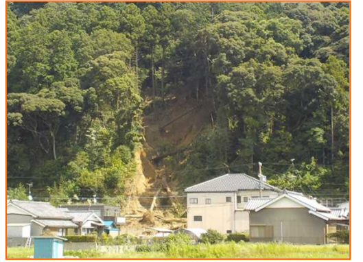
9/24 土石流等 静岡県川根本町田野口