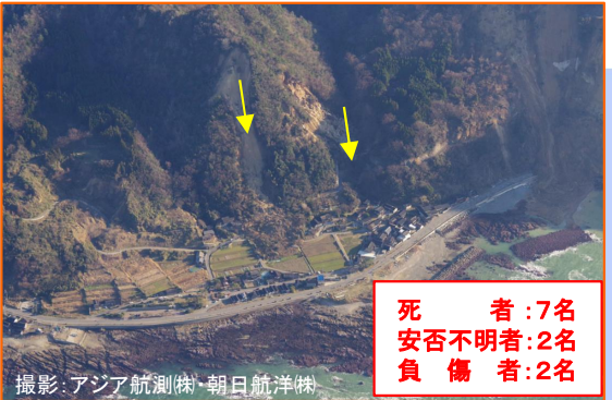
すずし にえまち ③石川県珠洲市仁江町 【道の駅すず塩田村の西側】