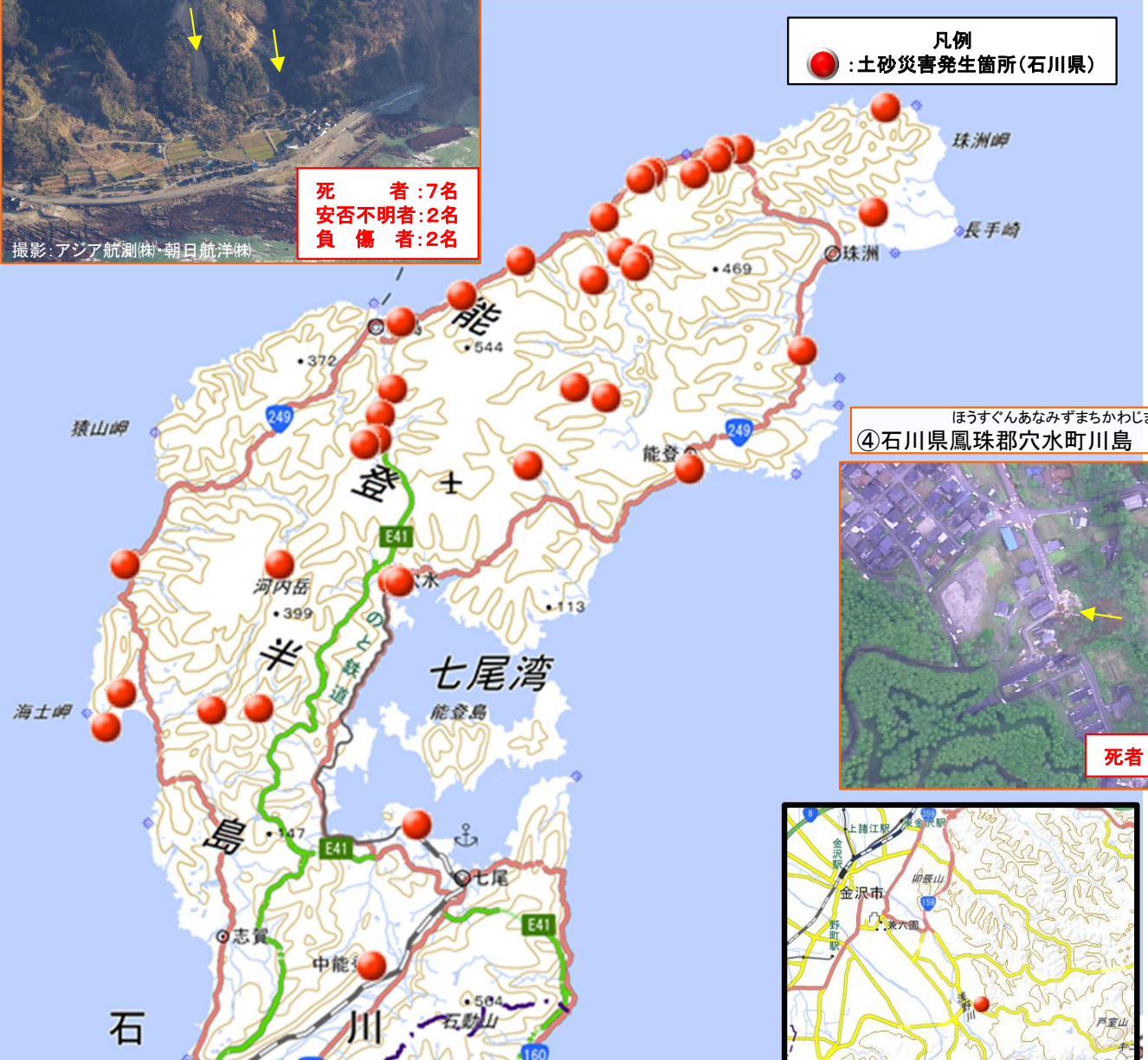
ほうすぐんあなみずましかわじま ④石川県鳳珠郡穴水町川島