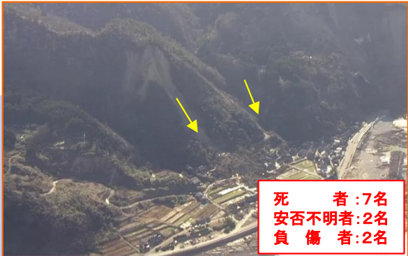
すずし にえまち ③石川県珠洲市仁江町 【道の駅すず塩田村の西側】