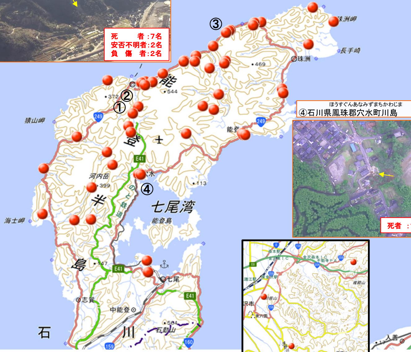
ほうすぐんあなみずまかわじま ④石川県鳳珠郡穴水町川島