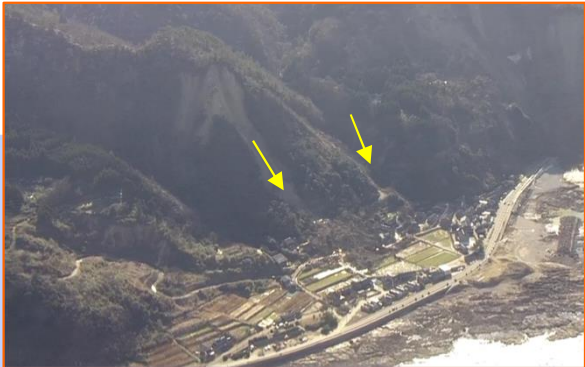
すずし にえまち ③石川県珠洲市仁江町 【道の駅すず塩田村の西側】