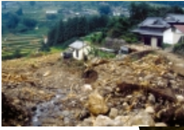
川内町の災害(平成11年)