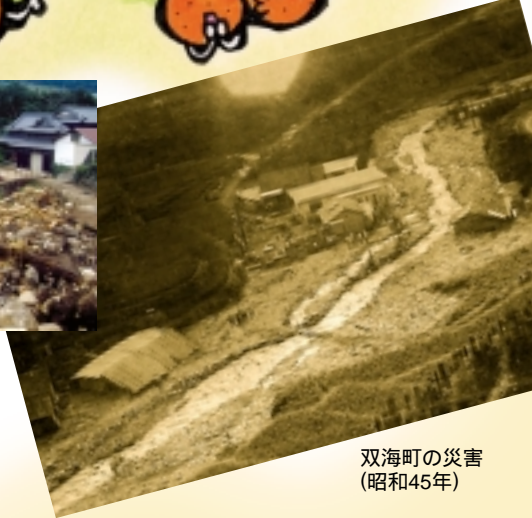
双海町の災害(昭和45年)