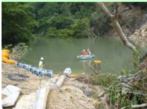
【排水ポンプ設置状況】

<工事用道路造成の間、排水ポンプ16台(約1.4m 3 /s)により水位を低下>