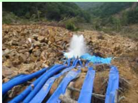
【排水ポンプ稼働状況】