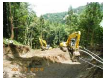
【工事用道路造成状況】