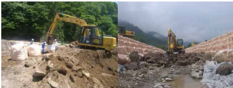
【仮排水路補修状況】