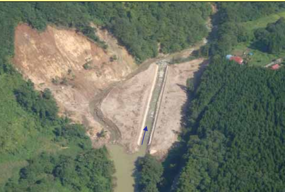
7月21日緊急対策完了