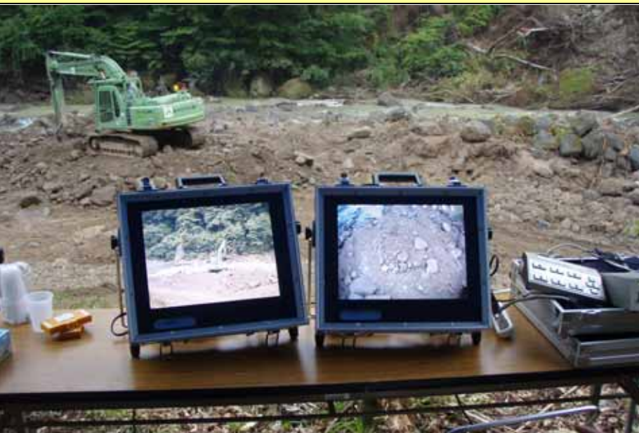
温湯地区（宮城県 栗原市）