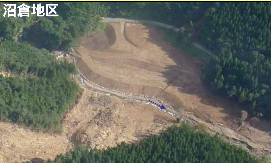
8月30日緊急対策完了