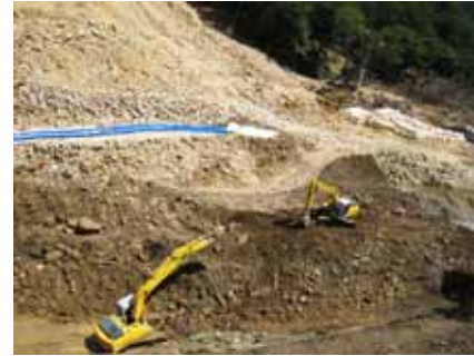
排水ポンプによる排水状況