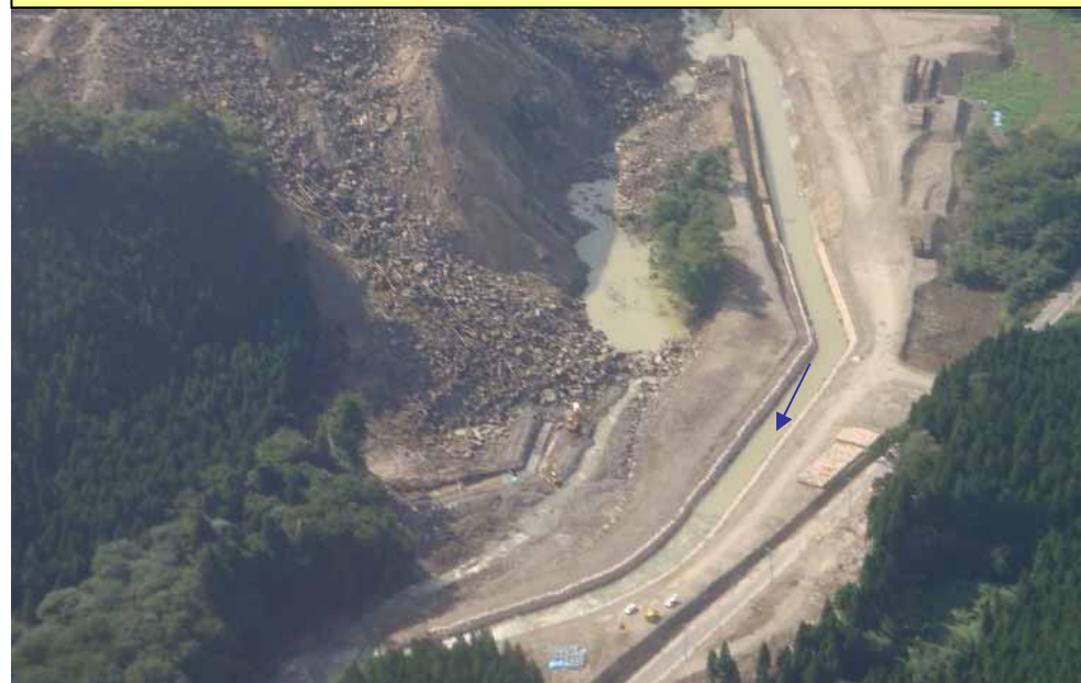
7月21日緊急対策完了