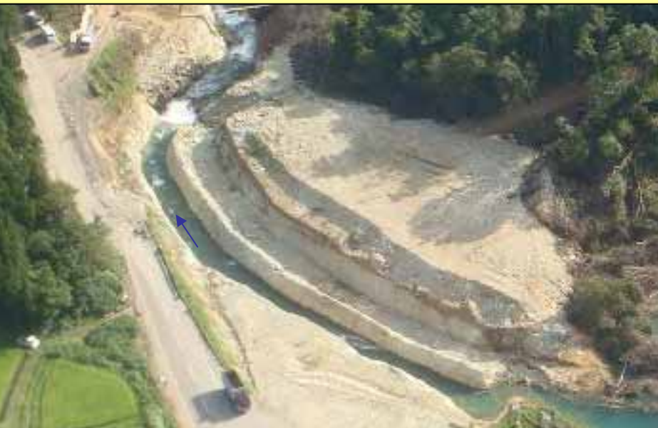
7月5日緊急対策完了