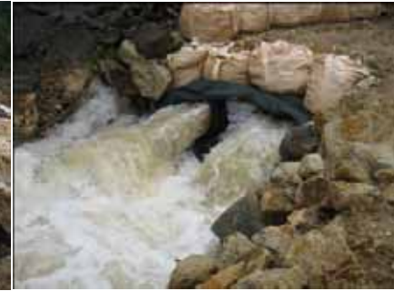
仮配水管による排水状況