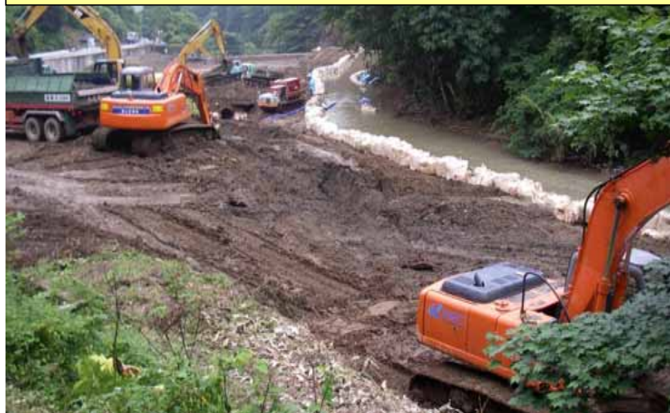
緊急除石工実施中