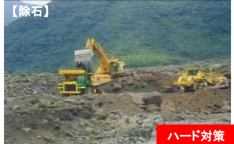
主なハード・ソフト対策のイメージ