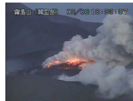
新燃岳の噴火状況(平成30年3月6日18時)