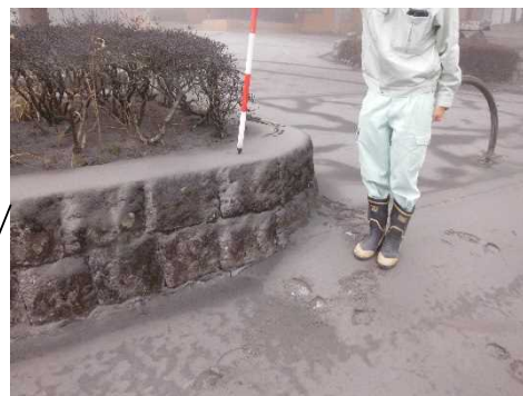
降灰調査の様子(平成30年3月7日)