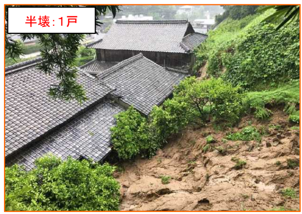
ひおき ひがしいちきちょう 鹿児島県日置市東市来町