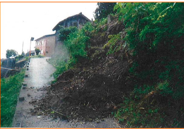
うおづ ゆのえ 富山県魚津市大字湯上