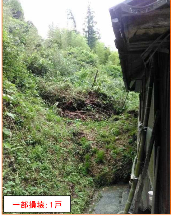
ほうすぐん のとちょう かきお 石川県鳳珠郡能登町大字柿生