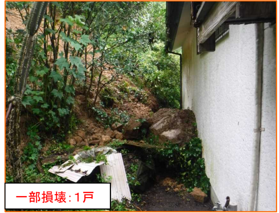
にちなん しもかた 宮崎県日南市大字下方