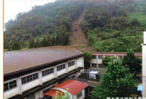
7/3 たるみず かいがた がけ崩れ 鹿児島県垂水市海湯