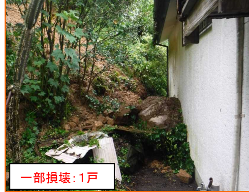
7/1 にちなん しもかた がけ崩れ 宮崎県日南市大字下方