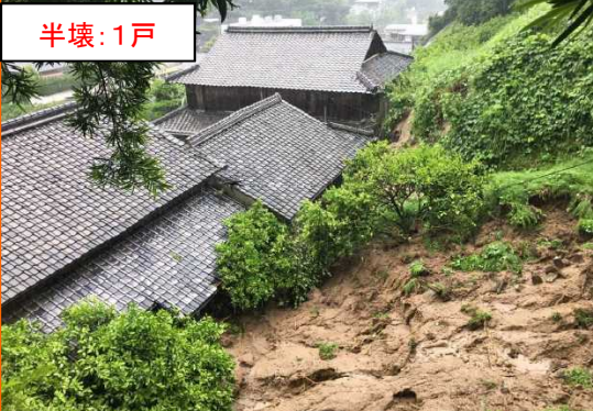
7/1 ひおき ひがしいちきちょう がけ崩れ 鹿児島県日置市東市来町