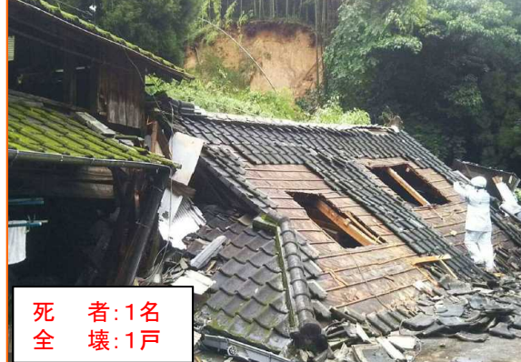
7/4 そおし おおすみちょう さかもと がけ崩れ 鹿児島県曾於市大隅町坂元

凡例 発生件数 10～ (Red) 5～ (Yellow) 1～ (Light Yellow) 0 (White)