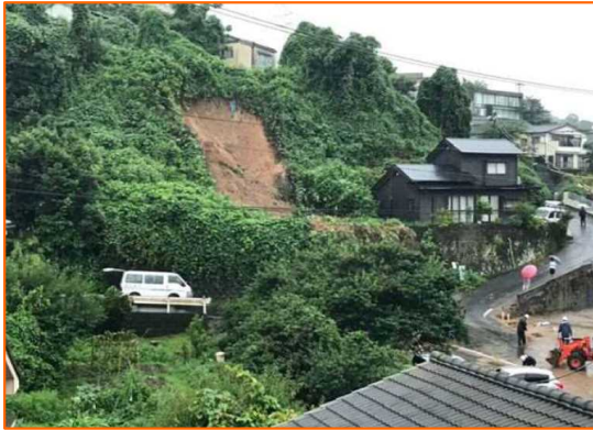
7/3 かごしま とそ がけ崩れ 鹿児島県鹿児島市唐湊3丁目