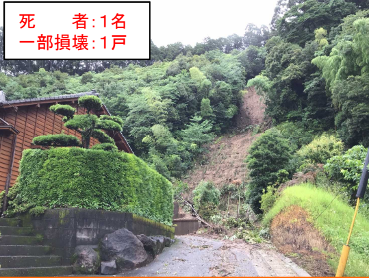
7/1 かごしま ほんじょうちょう がけ崩れ 鹿児島県鹿児島市本城町