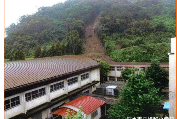
垂水市立協和小学校