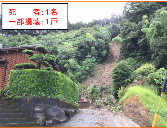
死者：1名 一部損壊：1戸