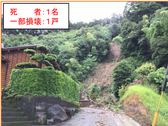
死者：1名 一部損壊：1戸