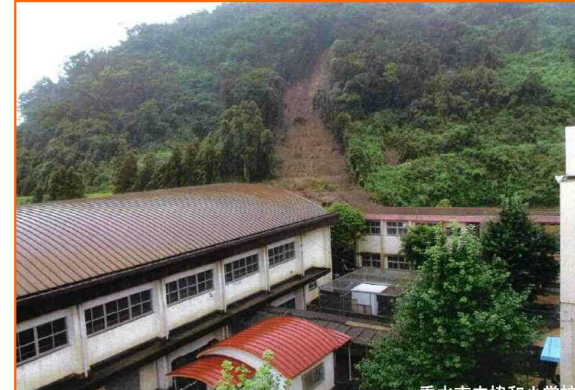
垂水市立協和小学校