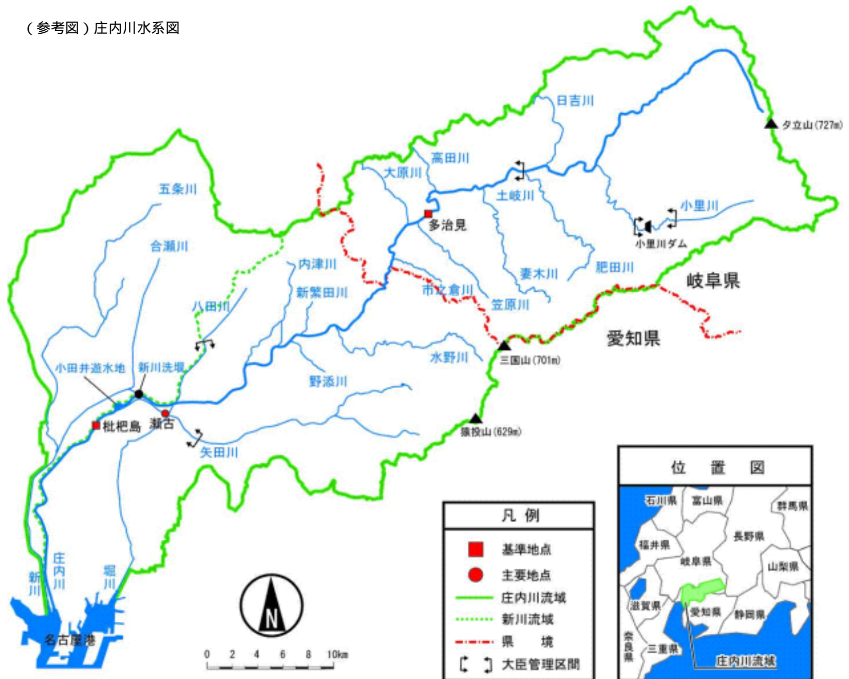
(参考図) 庄内川水系図