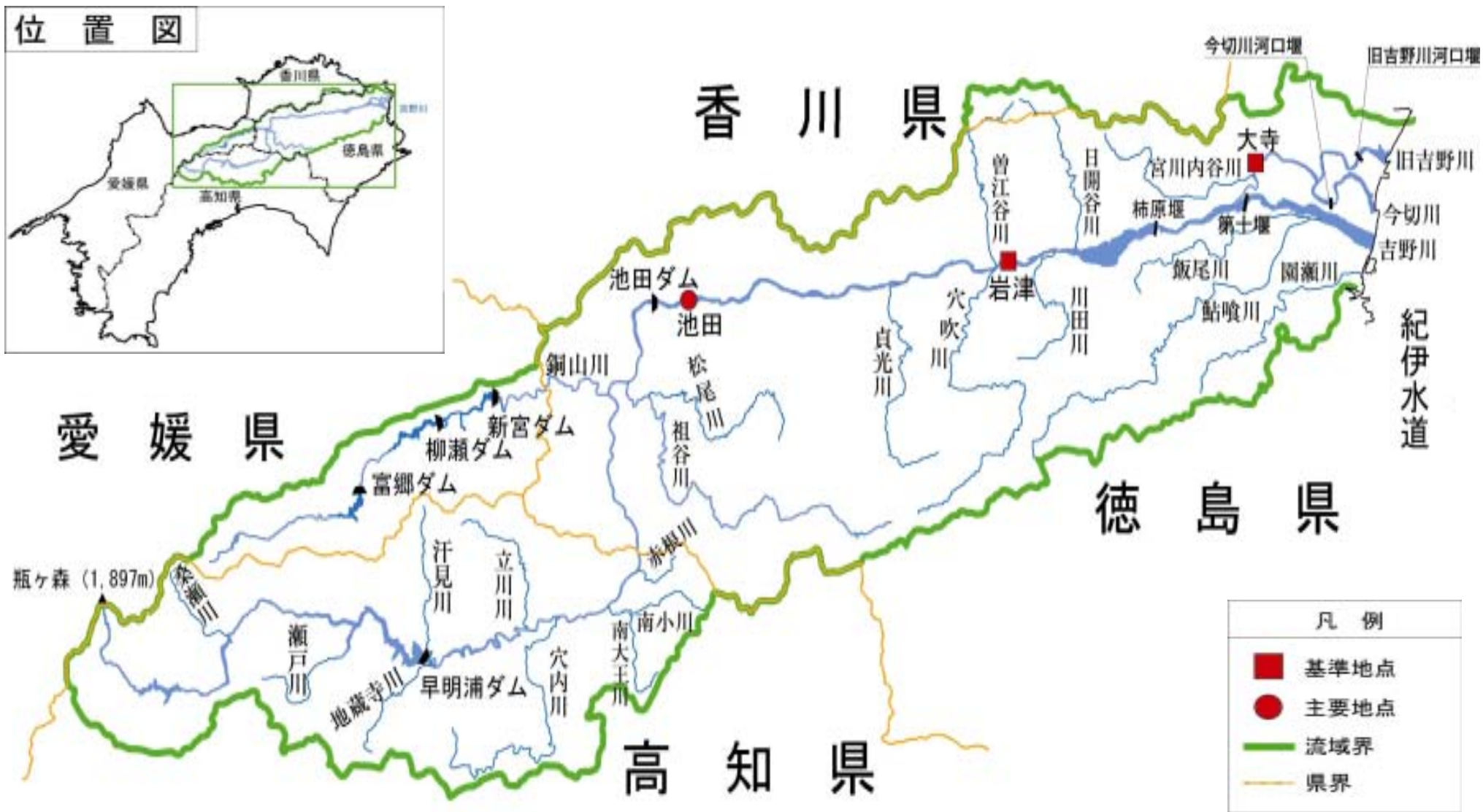
(参考図) 吉野川水系図