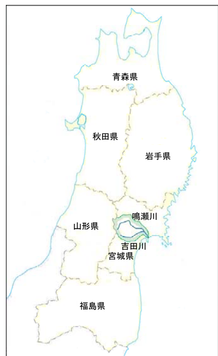
(参考図) 鳴瀬川水系図