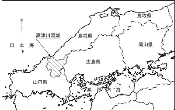
高津川水系流域位置図