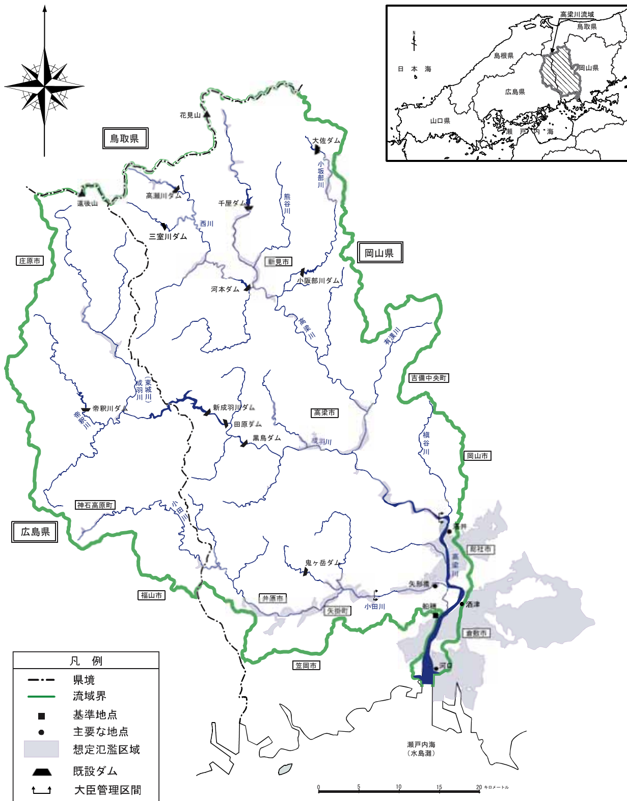
(参考図) 高梁川水系図