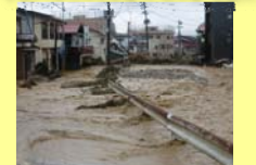
平成23年新潟・福島豪雨(新潟県・晒川)