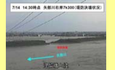
平成24年九州北部豪雨(熊本県・矢部川)