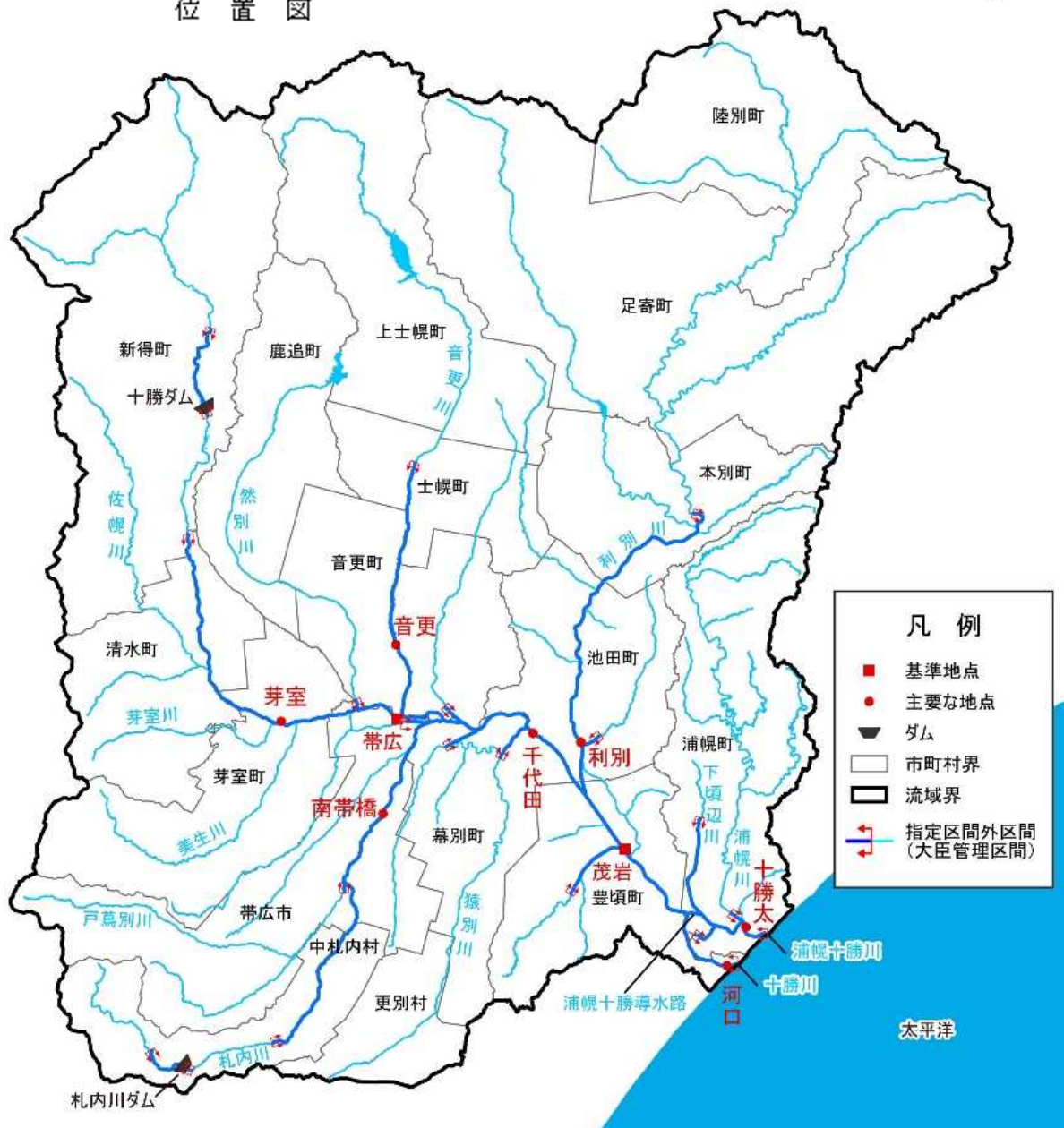
(参考図) 十勝川水系図