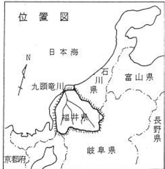
(参考図) 九頭竜川水系図