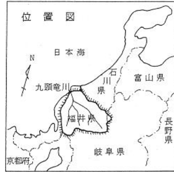
(参考図)九頭竜川水系図