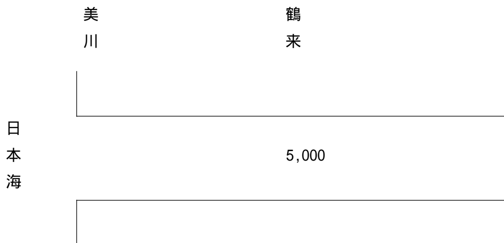
図 - 2 手取川計画高水流量図