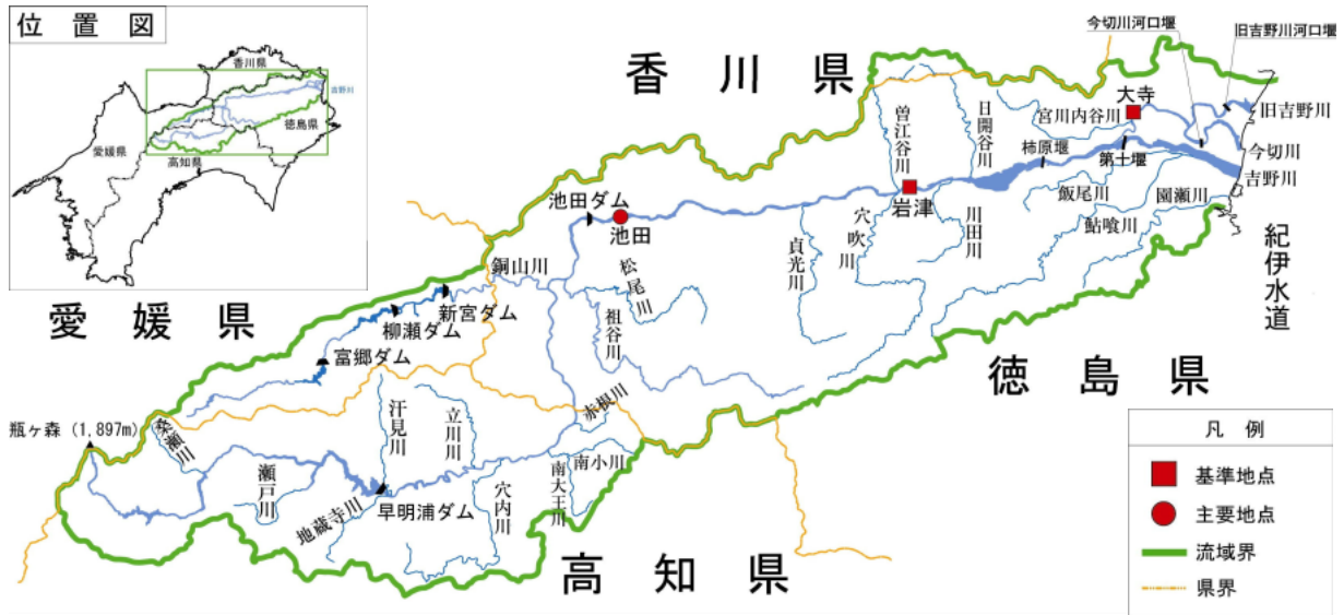
(参考図) 吉野川水系図