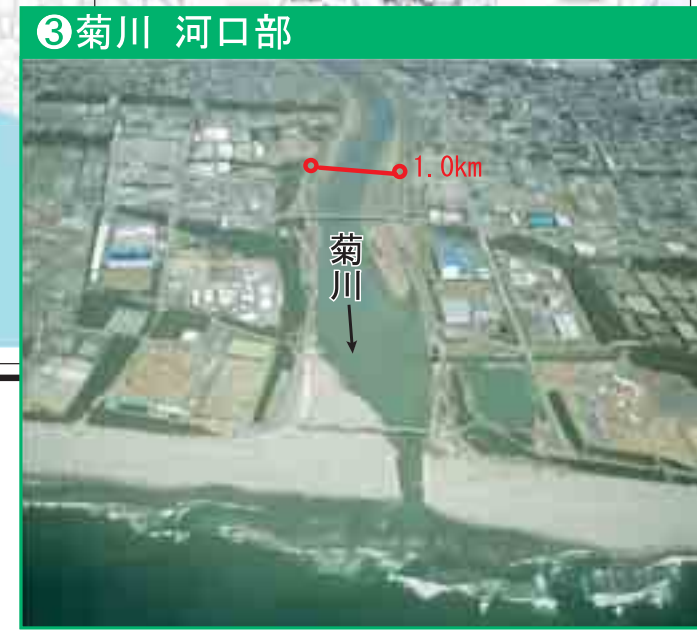
未施工区間については、堤防位置を示すものではない。