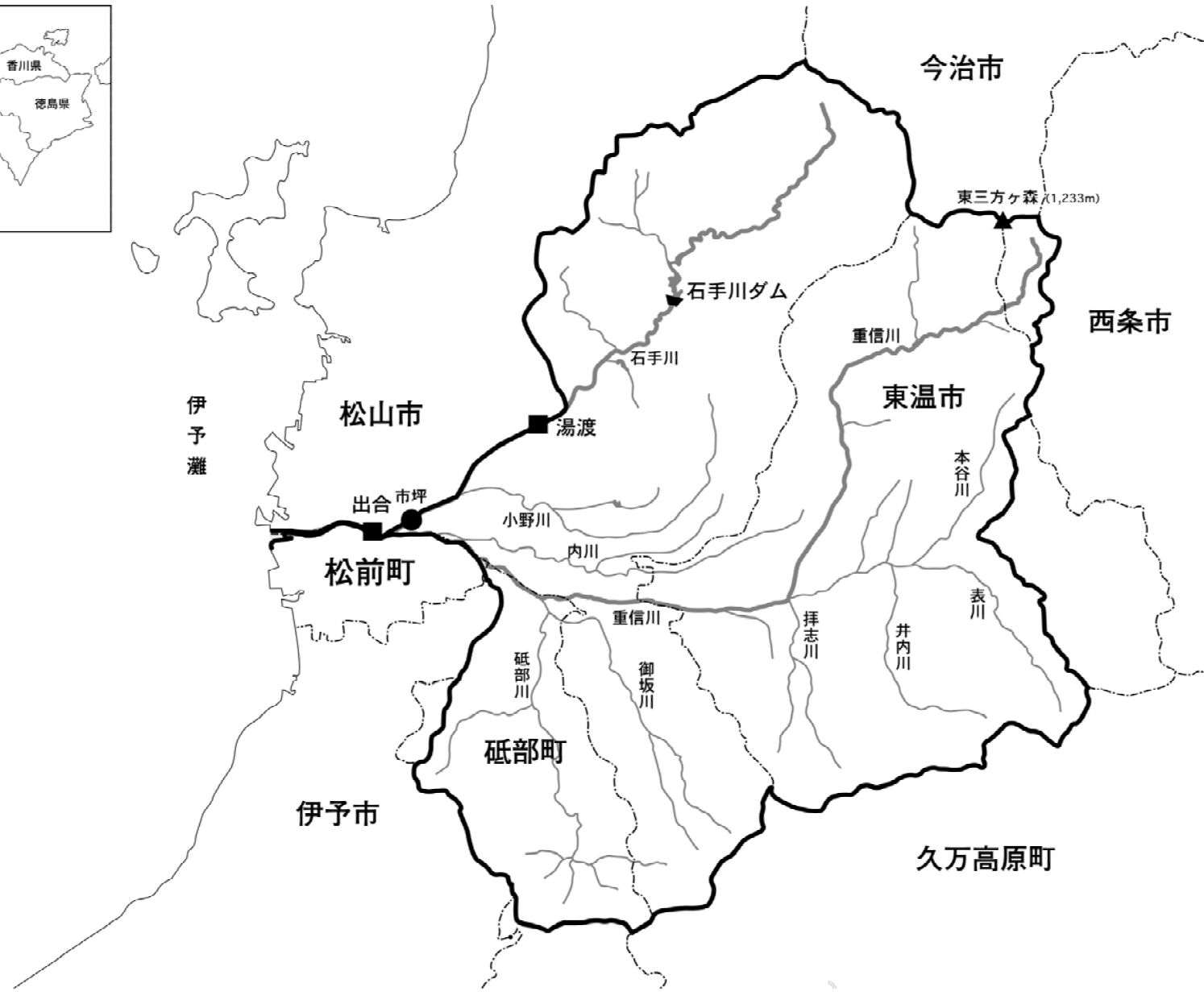
(参考図) 重信川水系図