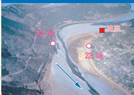
④ 神座地点(基準地点)