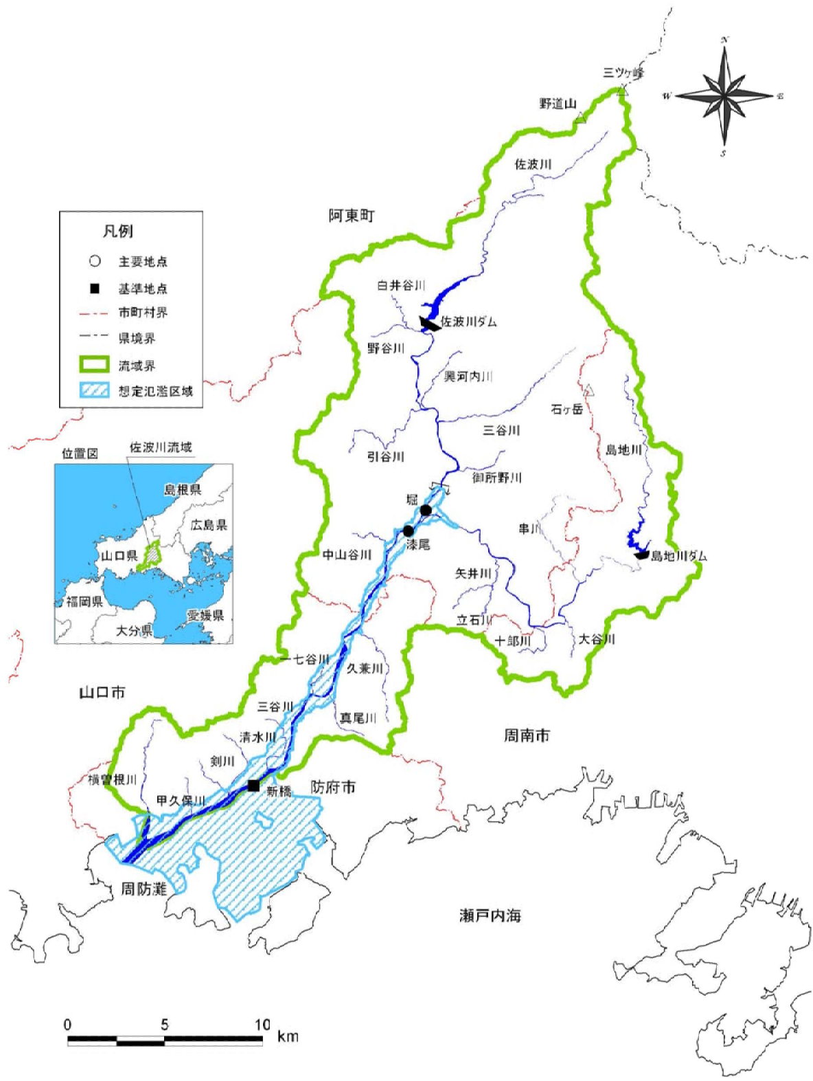
(参考図) 佐波川 水系図