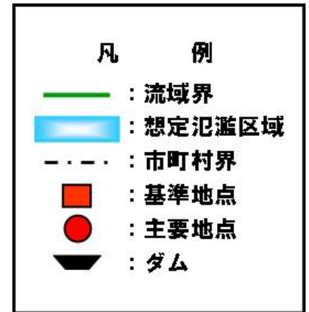
(参考図) 球磨川水系図