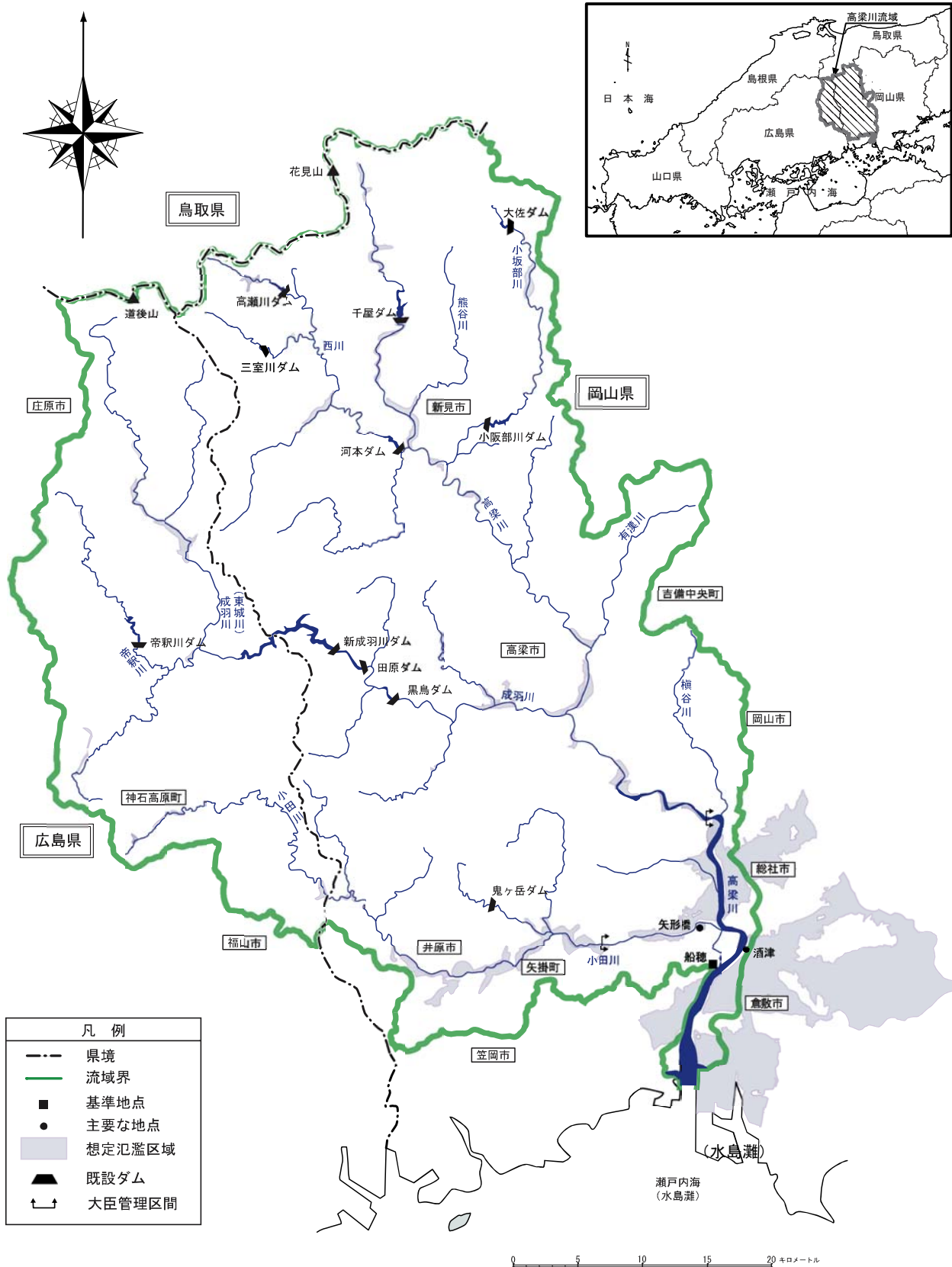
(参考図) 高梁川水系図